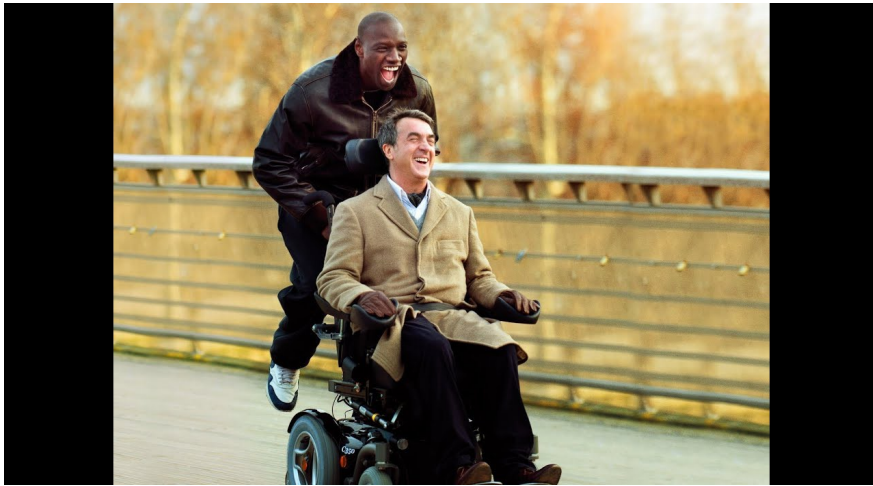
Intouchables (Omar Sy, François Cluzet).

Problématique : Une fois que le cerveau a intégré l'information, comment va-t-il la transmettre aux muscles pour commander un mouvement ?