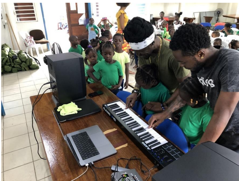
Photos 1 Initiation au piano.

La mairie a mis à disposition des instruments musicaux : piano, tambour traditionnel, guitares, flûte etc... Des professionnels étaient présents comme animateur pour jouer des instruments et inciter les élèves à se porter volontaire.