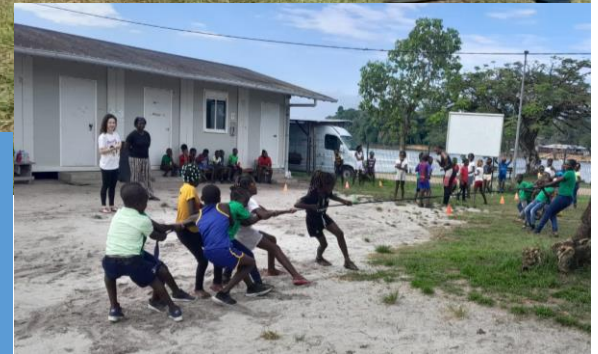
Photos de deux activités mises en place par des enseignants pendant la journée du sport.