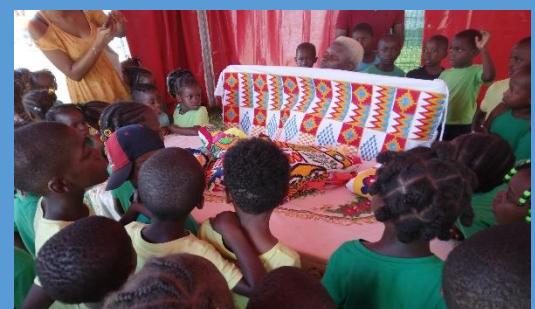
Photo d'élève devant un atelier de fabrication de pangui.

mais surtout écouter les différents intervenants présenter du « Afingi » (repas traditionnel) et du « Pangui ».