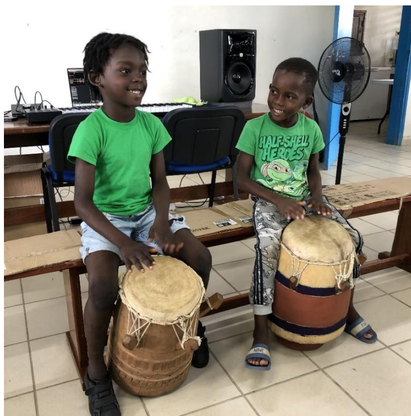
Photos 2 Initiation au tambour.