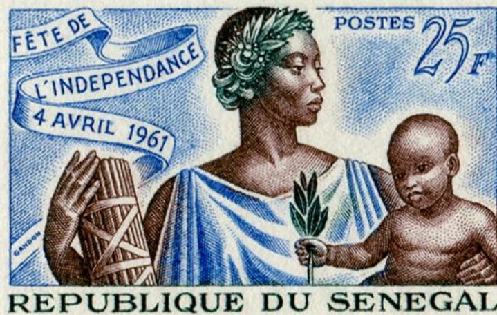
Timbre célébrant l'indépendance du Sénégal