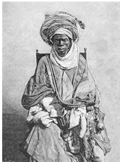
Yoruba en tenue traditionnelle Nigeria