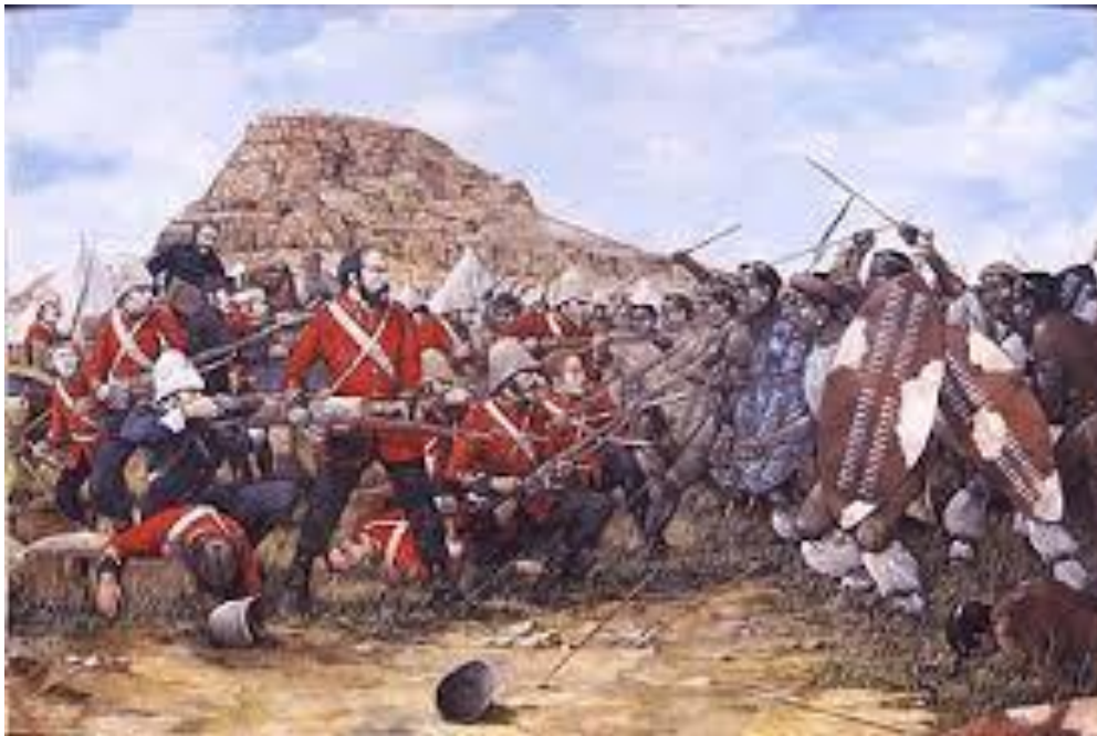
Bataille d'Isandhlwana, 1879, Afrique du Sud

1) Selon l'image, comment s'est déroulé la colonisation de l'Afrique ? Justifie ta réponse avec des arguments.