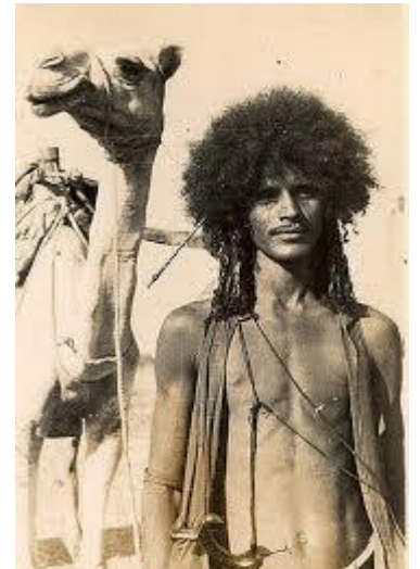
Homme beni amer Erythrée