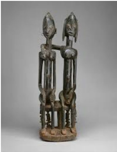
Figurine dogon Mali

Afin de parfaire tes connaissances sur l'Afrique, voici des photos et illustrations de peuples africains connus