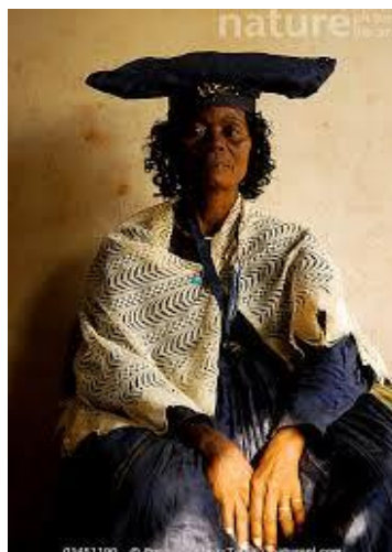
Femme herrero Namibie