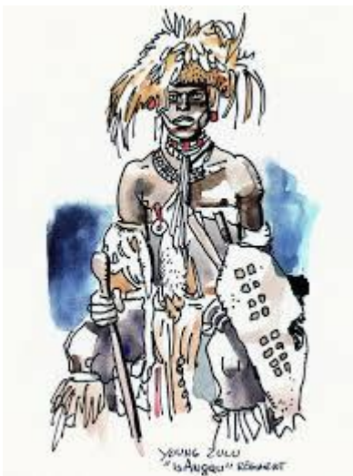
Guerrier zoulou Afrique du Sud