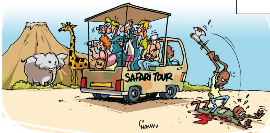
Paru dans France Catholique (Le Plessi Robinson) en janvier 2008, Chaunu, 2008.

3) Pour chacune des images, entourez en rouge le nom de l' auteur sur la légende correspondante et en bleu la date.